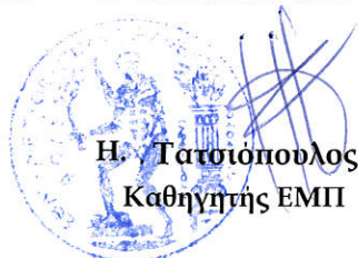
Η. Τατσιόπουλος Καθηγητής ΕΜΠ