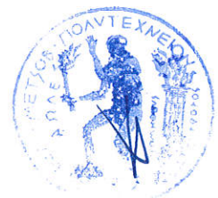
Επ. Καθ. Δ. Ναθαναήλ