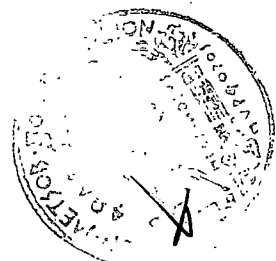
Αν. Καθ. Δ. Ναθαναήλ